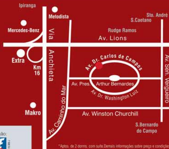
croqui de localização sem escala

Incorporação e Construção: GOLDFARB CONSTRUTORA PASSARELLI LTDA.