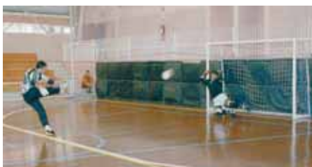
Carlão, garantiu o título com suas defesas