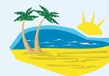
A Banda Matriz agitou a noite