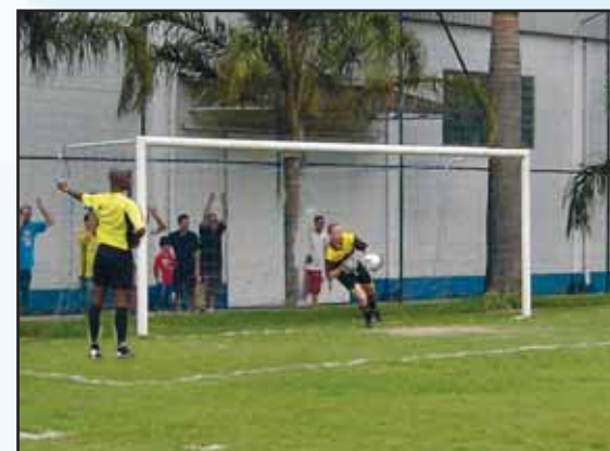
Acima, a bela defesa do zagueiro/goleiro durante cobrança de pênalti