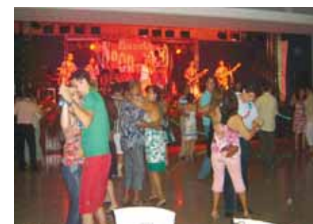
A Banda Neon 2000 cuidou da animação