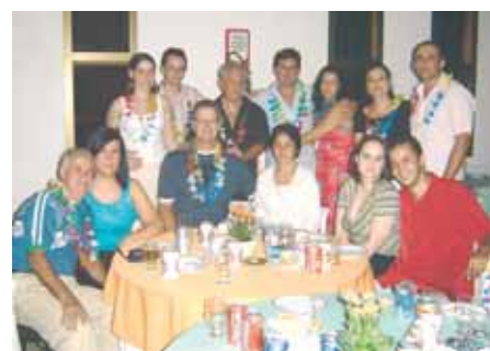
O pessoal do departamento de Esportes da ADC marcou presença