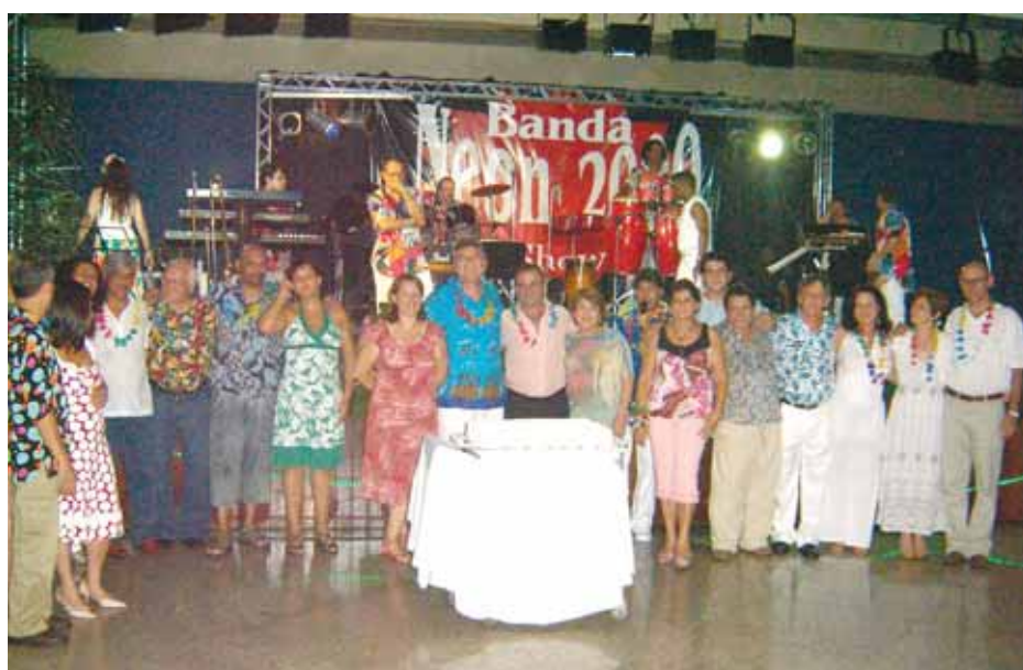
A diretoria da ADC reunida para "parabéns a você" e o bolo de aniversário, depois servido a todos

Ao som de boa música, boa comida, noite de clima agradável e muita alegria, aconteceu na noite do dia 16 de dezembro o último jantar dançante da ADC GM de São Caetano, a Noite Tropical.