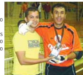
De cima para baixo, Amigos dos Amigos, na mesma foto Restaurante e Real e Du, o goleiro menos vazado.