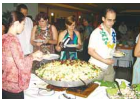
Risoto com frutos do mar foi o prato principal, preparado pelo Buffet Bonneville

Confira nas fotos lances da Noite Tropical.