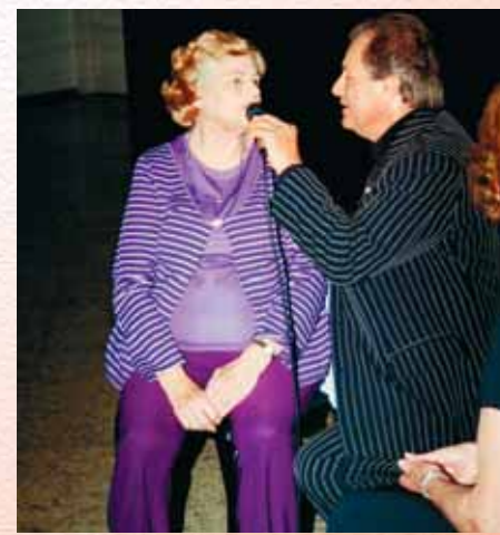
Homenagem à Mama