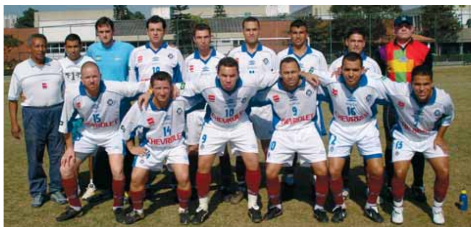
GM - A