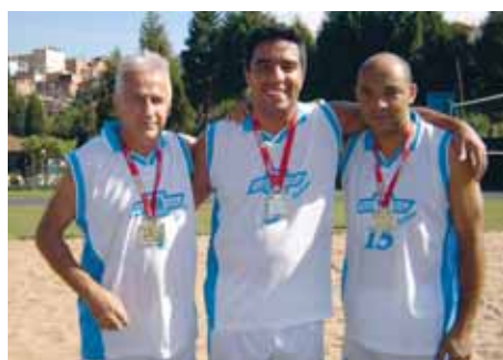
Equipe de futvôlei

No mês de junho conquistaram medalhas de ouro as equipes de Futebol B, Futvôlei e Vôlei de Areia. A equipe de Atletismo, Damas, Futebol A e Tênis de Campo conquistaram medalhas de prata. A expectativa é que mais medalhas sejam ganhas. Faltam ainda disputas nas seguintes modalidades: xadrez, futsal principal, queda de braço, tênis de campo máster e duplas, tênis de mesa simples e duplas, sinuca e truco.