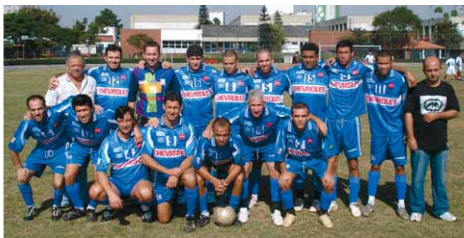
GM - B