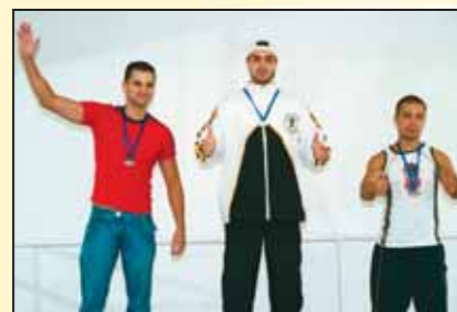
Adriano, Julio Cesar e Jeferson