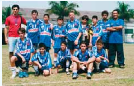
O Soletrando jogou um bom primeiro tempo, mas cansou no segundo