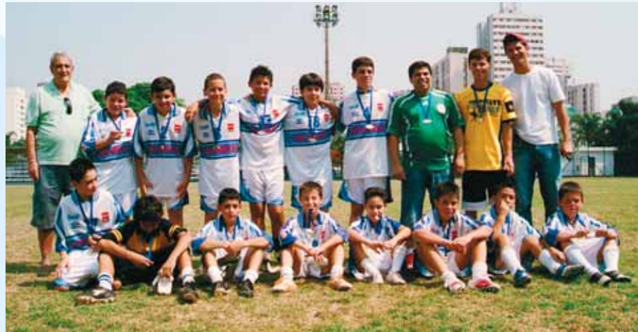
A equipe Ídolos apresentou futebol mais consistente e foi mais eficiente nos arremates