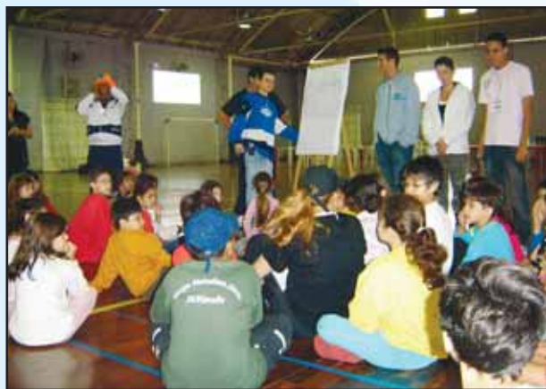
À esquerda e à direita: todos reunidos, atentos às instruções de cada brincadeira ou atividade