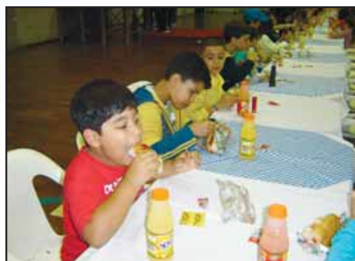
Caçar o tesouro deu uma fome...