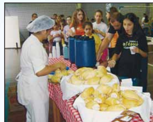
Um café da manhã caprichado para aguentar novas brincadeiras