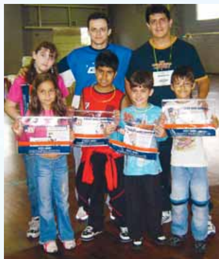
Os ganhadores de bolsa de estudo em curso de inglês