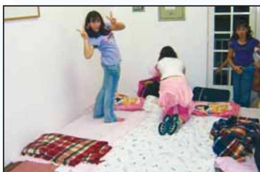
Arrumando as camas para dormir