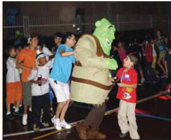
A garotada se divertiu na balada em companhia do Shrek