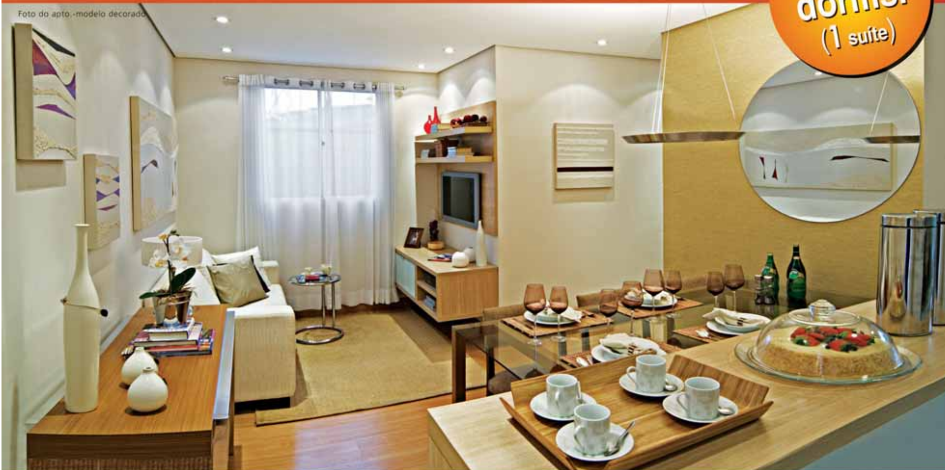
Foto do apto. - modelo decorado