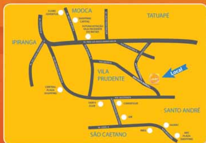
Croqui ilustrativo de localização sem escala